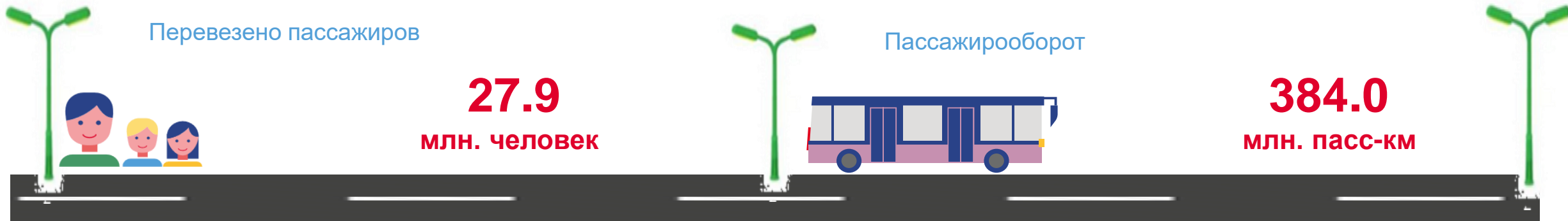
Пассажирские перевозки за январь-февраль в % к соответствующему периоду предыдущего года